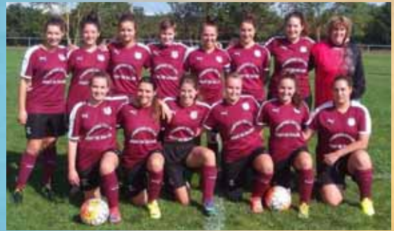
La nouvelle équipe des seniors, digne représentant des 61 féminines du club

En parallèle du pôle sportif , cinq commissions impliquant de nombreux dirigeants organisent la vie associative et éducative de l'association. La bonne dynamique au sein de ces commissions contribue grandement à la bonne marche de la JSL depuis plusieurs saisons. Pour de plus amples renseignements, vous pouvez consulter le site internet du club ( www.js-levezou.fr )