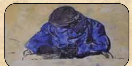
Dessins réalisés par les enfants des deux écoles de Flavin